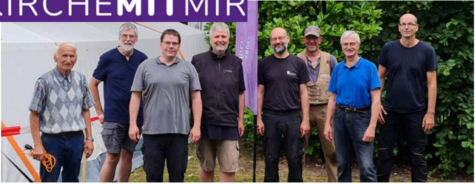
Das Aufbauteam für die großen Zelte beim Jugendzeltten