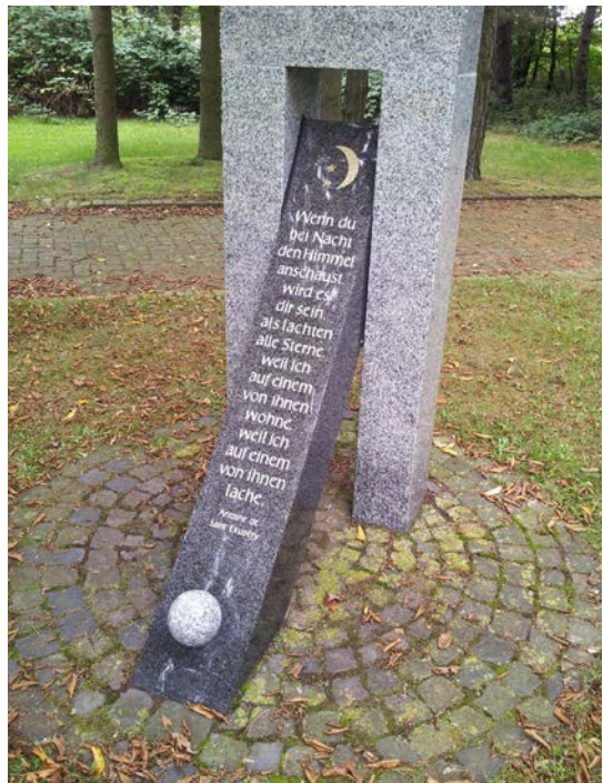
Auf dem Friedhof am Kräher Weg in Nienburg gibt eine Gedenkstätte für Sternenkinder