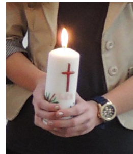
Der Abendmahlsaltar bei der Konfirmandenfahrt eine der selbst angefertigten Taufkerzen für ein Jugendtauffest