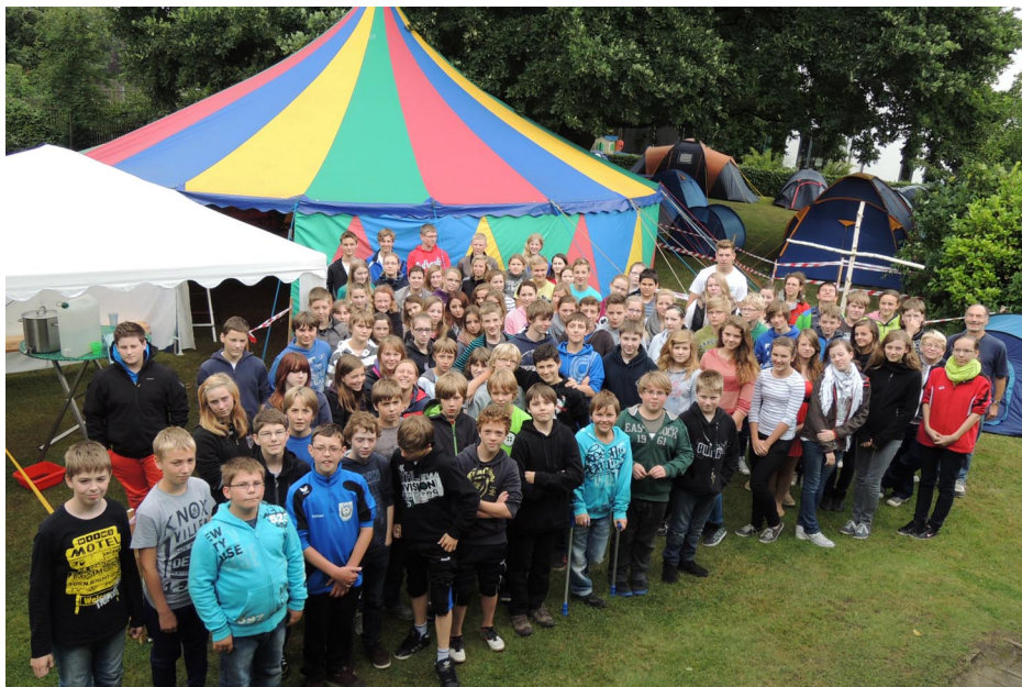
Jugendzelten im Sommer 2012 im Garten des Gemeindehauses

Diese Ordnung haben Kirchenvorstand und Pfarramt am 17. Januar 2013 gemäß §13 des Kirchengesetzes über die Konfirmandenarbeit vom 14. Dezember 1989, zuletzt geändert durch das Kirchengesetz vom 9. Juni 2011 (Kirchl. Amtsbl. S. 154), beschlossen. Der Kirchenkreisvorstand im Kirchenkreis Nienburg hat diese Ordnung mit Beschluss vom 19.02.2013 genehmigt. Sie gilt erstmalig für den Konfirmandenjahrgang 2013-2015.